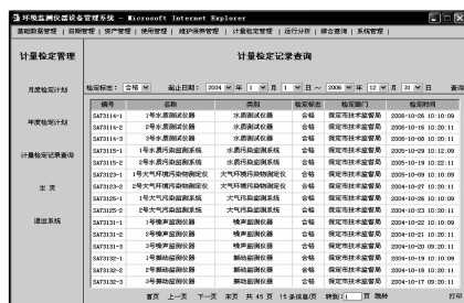
图 3 计量检定记录查询界面

系统具有统一的“T”字形界面,上面部分为系统主菜单,左面为系统子菜单,右面为具体的菜单功能项界面,这样能够保证用户使用方便、快捷。计量检定管理中的计量检定记录查询界面见图 3。