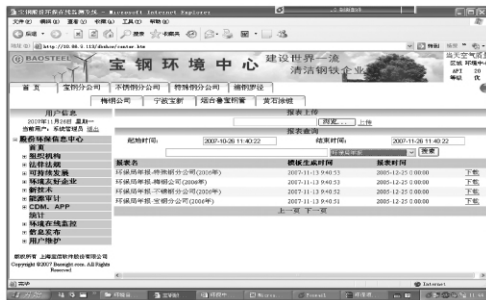
图 4 摇统计功能

宝钢环境信息系统中,可生成环境监测日报、周报、月报、季报和年报等,以及钢铁协会或者环保局所要求的其他相关的报表,可提供在线数据实时查询、报警、分析等功能,见图 4。在宝钢股份公司信息中心,系统提供以上相关要求的报表模版生成、报表提交、下载、查询、审核和打印等功能需求。