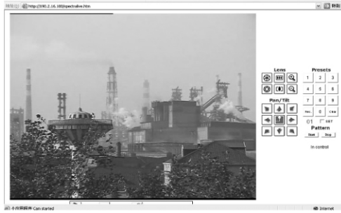
图 3 摇厂区视频监控