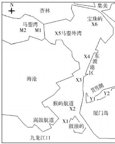
图 1 厦门西海域采样站位分布

大, 近两年刚进行大规模疏浚, 今后还会疏浚; 马銮湾两个 (M1、M2 站), 受杏林工业区排污影响大, 近期将进行大规模疏浚; 厦门西港 6 个 (X1) X6 站), 其中 X1 为嵩鼓航道; X2 为猴屿航道, 排污口附近, 受到城市污水影响较大, 这两站均为厦门西港的主航道, 疏浚量大; X3、X4 为东渡港区, 有港口污水排入, 每年需要疏浚; X5 为马銮外湾, 杏林工业区及其污水处理厂排污口附近; X6 为宝珠屿北部内湾, 水浅流缓。以上站位均为拟疏浚的主要区域。